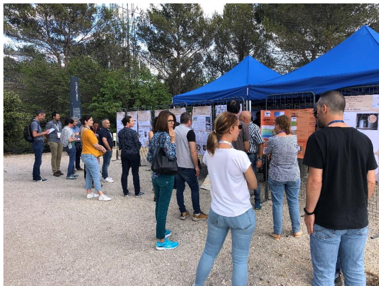
Figure 2 : Session poster Poster session