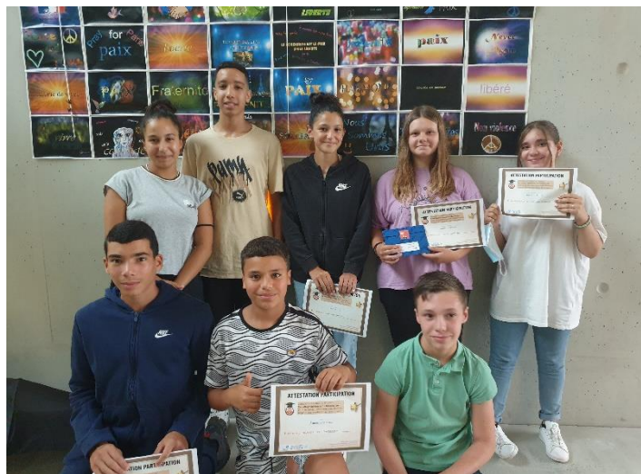
Figure 4 : Club Namazu du collège Les Mimosas à Mandelieu Club of the college Les Mimosas in Mandelieu