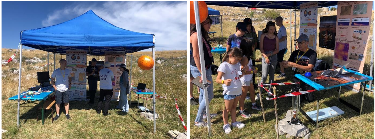
Figure 5 : Stand InSight Education à la NCO 2022 de l'OCA InSight Education booth at the OCA NCO 2022

La team InSight Education est partout ! The InSight Education team is everywhere!