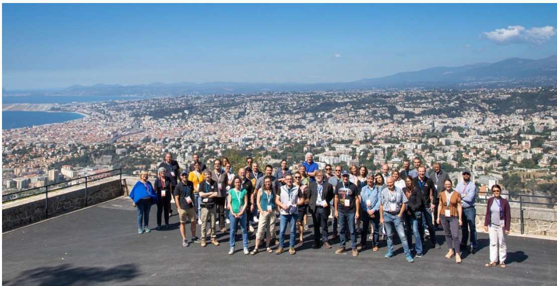
Figure 1: Photo de groupe avec panorama sur la ville de Nice depuis le site du Mont Gros de l'OCA Group photo with panorama on the city of Nice from the Mont Gros site of the OCA

And here are some pictures of the day at the Mont Gros Observatory! 😊