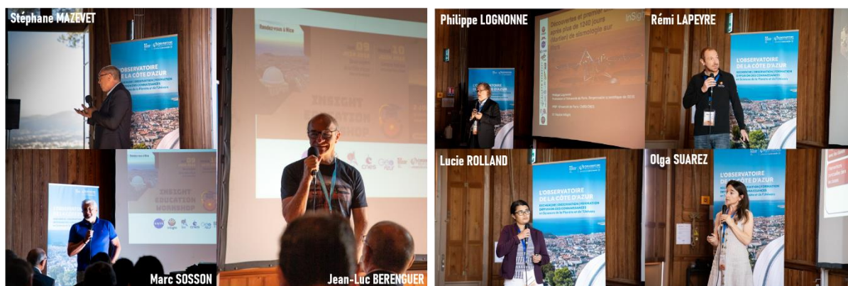
Figure 3 : Conférenciers du jeudi matin Thursday morning speakers

La saison 2021-2022 des défis Namazu est terminée ! The 2021-2022 season of Namazu challenges is over!