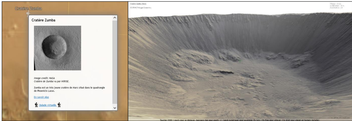
Exemple du terrain 3D proposé pour le cratère Zumba. Example of the proposed 3D terrain for the Zumba crater.