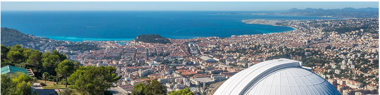
Vue sur Nice depuis le site du Mont Gros de l'Observatoire de la Côte d'Azur. View of Nice from the Mont Gros site of the Observatoire de la Côte d'Azur.

If you are interested in this seminar, as the number of places is limited, please contact us at : insight@geoazur.unice.fr